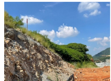
แนวเวนไม่ทำเหมือง