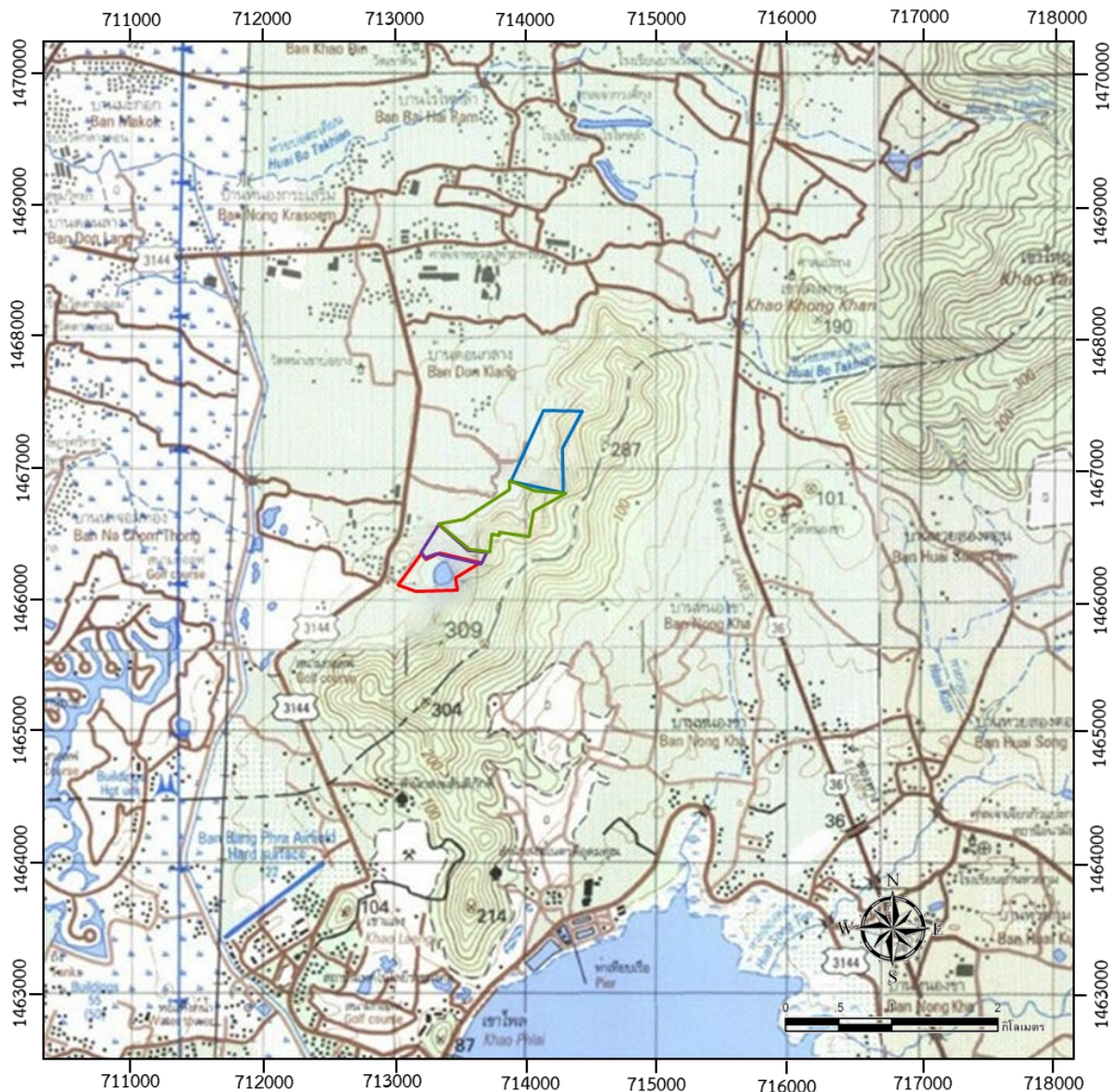
รูปที่ 1-1 แสดงตำแหน่งที่ตั้งพื้นที่โครงการ