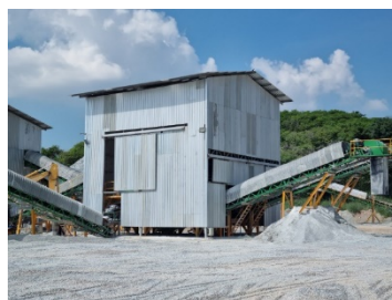
โรงไม้หินของโครงการ