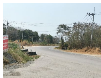
ทางหลวงหมายเลข 3144