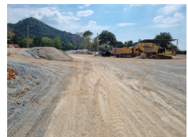
เส้นทางขนส่งแร่ระหว่างหน้าเหมือง-โรงไม้หิน