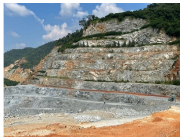
พื้นที่หน้าเหมืองปัจจุบัน

พื้นที่โครงการ ประทานบัตรที่ 21378/15248